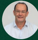
Enio Bergoli Secretário de Estado da Agricultura, Abastecimento, Aquicultura e Pesca.