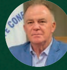
Renato Casagrande Governador do Espírito Santo